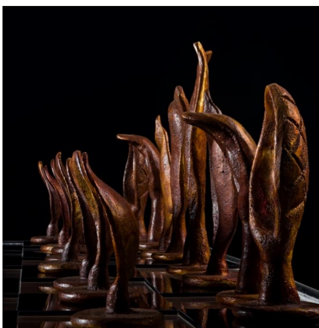
Ajedrez. 2020. Bronce.