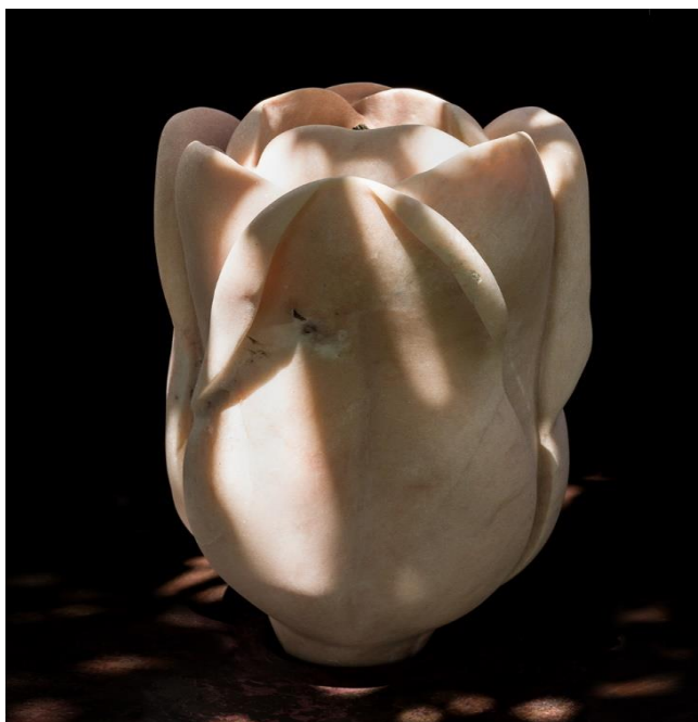
Flor. 2020. Mármol 31 x 24 cms.