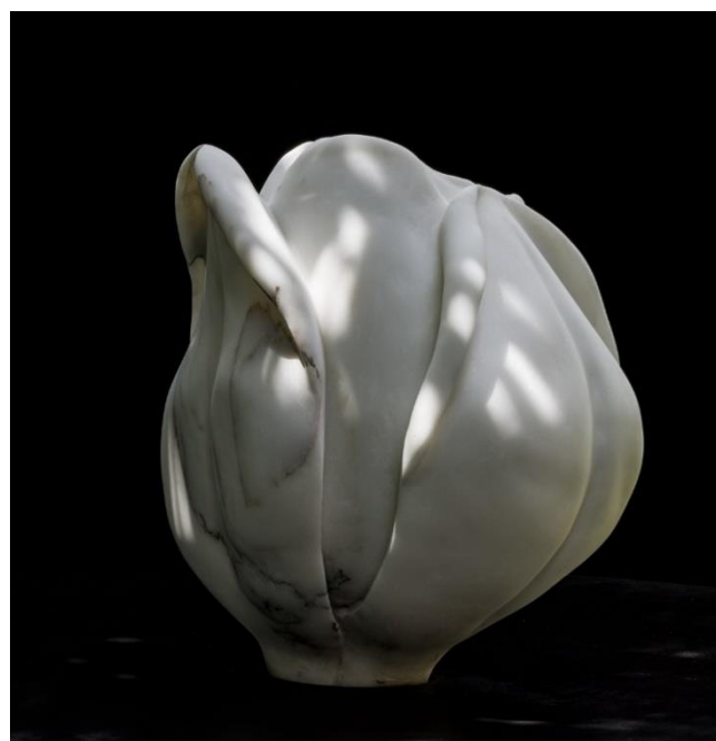
Flor. 2020. Mármol 25 x 25 cms.