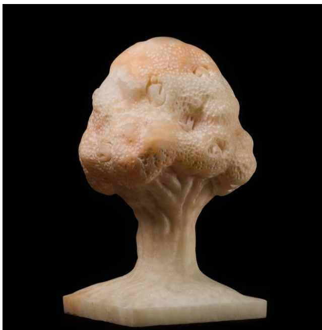
Árbol. 2020. Mármol 31 x 21 x 31 cm