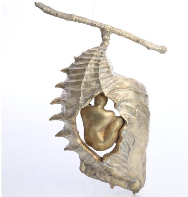
Crisálida. 2020. Bronce 55 x 25 x 14 cm