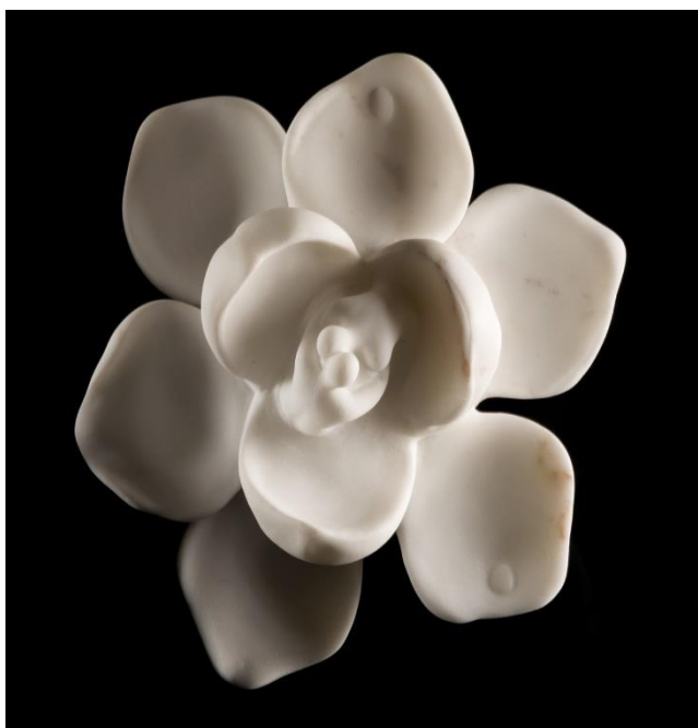
Flor. 2020. Mármol 26 x 17 cm