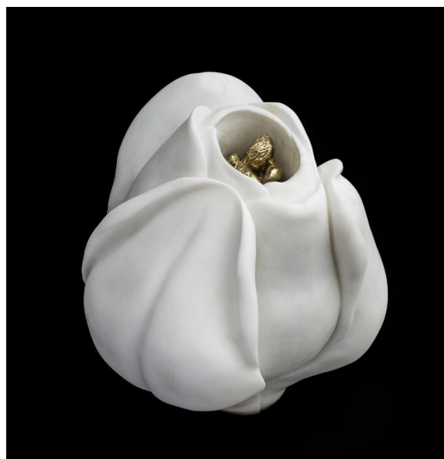
Flor. 2020. Mármol 25 x 25 cms.