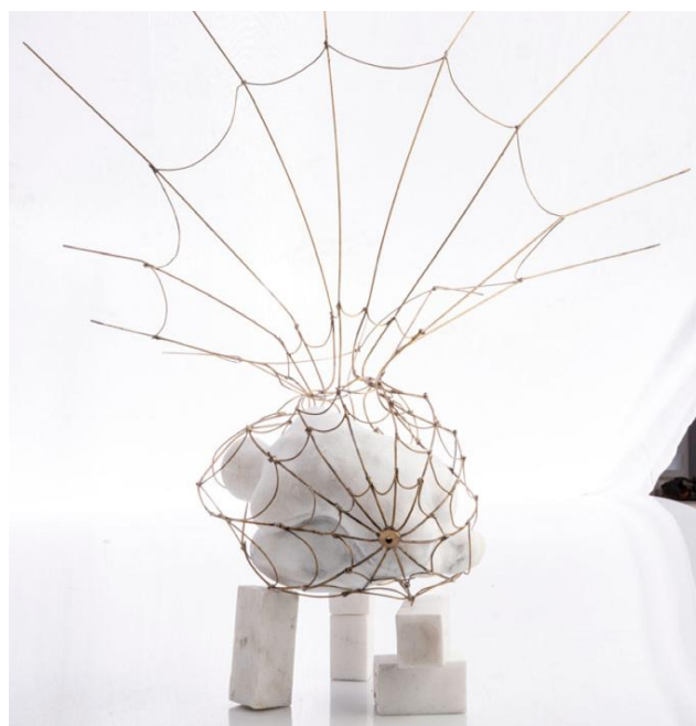
Atrapada en la red de araña. 2020. Alabastro 31 x 17 x 18 cm